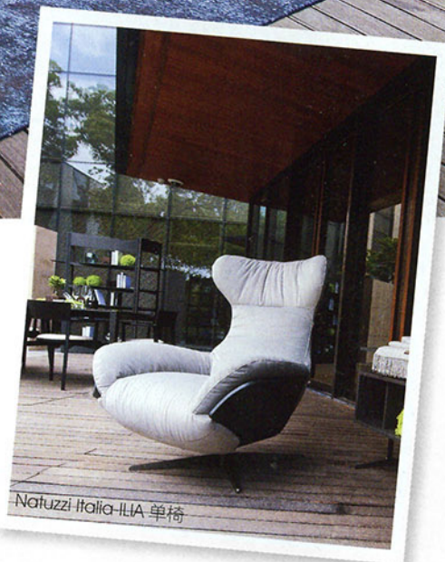
Natuzzi Italia-ILIA 单椅