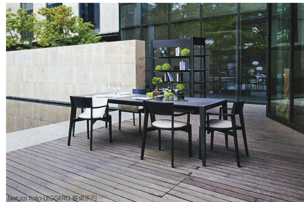
Natuzzi Italia-LEGGERO 餐桌系列